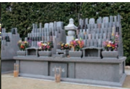
墓石は宝塔の上でお祀りいたします