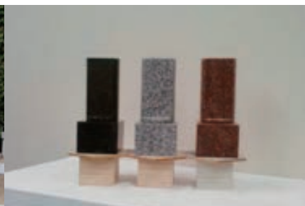
墓石はお好きな石種をお選びいただけます