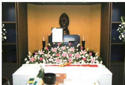
通夜式・告別式祭壇(写真はイメージです)